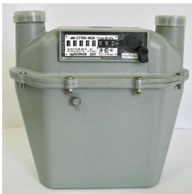
Схема пломбировки и обозначение мест для нанесения пломб и наклеек для защиты от несанкционированного доступа